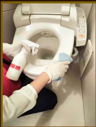
トイレ（蓋・便座・水洗レバー・ウォシュレットボタン・ペーパーホルダー）