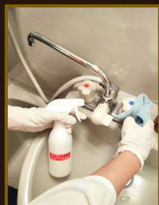
蛇口・シャワー切替レバー